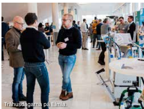
Trähusdagarna på Elmia.