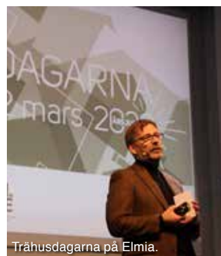
Trähusdagarna på Elmia.