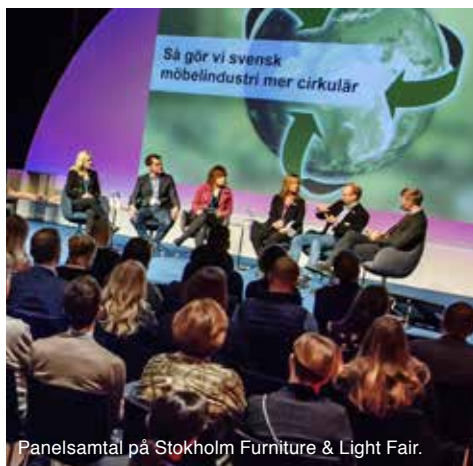
Panel samtäl på Stockholm Furniture & Light Fair.