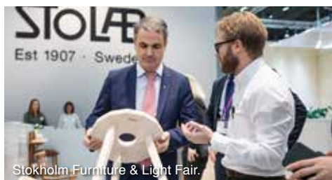
Stockholm Furniture & Light Fair.