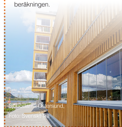
Sjööbodarna i Östersund.

När det gäller energifrågan för nyproduktion handlar engagemanget framförallt om de skärpta energikrav för byggnader som är på gång från Boverket. TMF arbetar för rimliga och över en livstid optimala krav där också produktionsmaterial och produktionsteknik tas med i beräkningen.