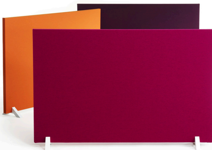
Rumsavdelaren Face från Martela är en av många möbler som är märkt Möbelfakta.

Inom branschutveckling finns två tekniska kommittéer, en för möbler & inredning och en för trähus. I den för möbler & inredning medverkar kvalitets- och miljöchefer från branschen och gruppen utgör remissinstans för förändringar av innehållet i Möbelfakta. TK möbler sammanträdde två gånger under 2019.