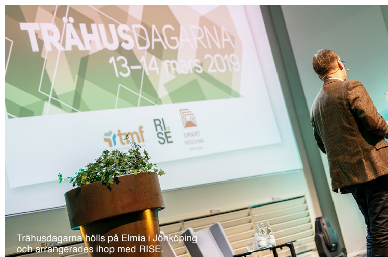
Trähusdagarna hölls på Elmia i Jönköping och arrangerades ihop med RISE.

Nationalmuseum nyinrigades hösten 2018 och flera