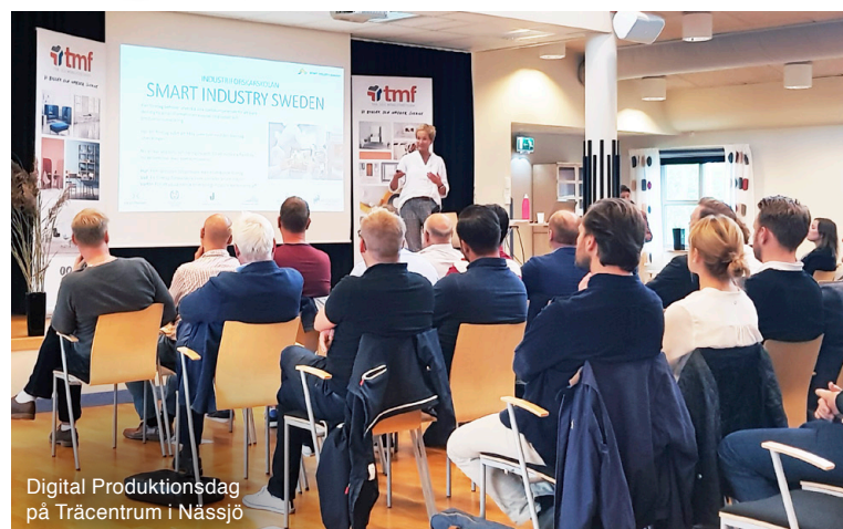
Digital Produktionsdag på Träcentrum i Nässjö